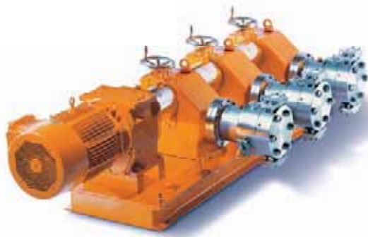
Bomba dosificadora de membrana hidráulica, ORLITA®

ProMinent ha respondido rápidamente a las crecientes necesidades en la industria del gas y del petróleo: ampliando la gama de productos con bombas dosificadoras de proceso especiales para el sector High-End, las cuales son adecuadas incluso en las condiciones más duras; gracias a su robusto diseño, sus materiales especiales y a su viabilidad a una amplia variedad de aplicaciones.