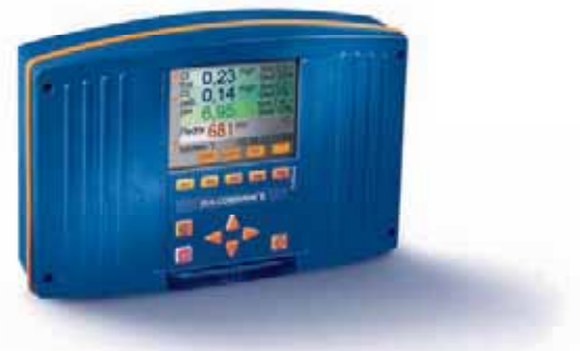
Controlador de Piscinas DULCOMARIN® II

Desde hace décadas, ProMinent ha sido uno de los socios líderes en el sector de las piscinas. Ya sea en las piscinas de wellness en hoteles o los mayores parques acuáticos- ProMinent acompaña a sus clientes desde la idea inicial hasta la puesta en marcha del proyecto. El resultado es siempre perfecto, agua de piscina tratada, que proporciona bienestar a todos: a los operadores de las piscinas, quienes aprecian el tratamiento eficaz del agua y la mejor de las tecnologías; y a los bañistas, quienes aprecian el agua cristalina y libre de gérmenes.