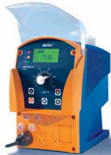
Bomba dosificadora de membrana delta® con accionamiento magnético controlado optoDrive®

Nuestros clientes solicitan algo más que solo funcionalidad. Esta es la razón por la cual nuestra perfecta tecnología está incorporada dentro del concepto de una solución altamente eficaz. Para nosotros, esto significa un compromiso dinámico en investigaciones continuas y en el desarrollo de nuevos productos. Los resultados hablan por sí solos. Muchas de las innovaciones actuales llevan nuestra firma. Y las mejores incluso nuestro nombre.