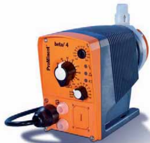
Bomba dosificadora magnética Beta® b

El agua higiénicamente limpia es el resultado de un complejo proceso de tratamiento. Independiente del proceso utilizado para ello. En este campo dominamos todas las tecnologías innovadoras necesarias. Le proporcionamos la tecnología perfectamente integrada a un sistema para el tratamiento y la desinfección del agua. Todo de una sola fuente.