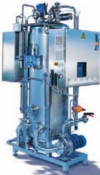
Sistema compacto de ozono OZONFILT® OMVa

Comer y beber, un verdadero placer con ProMaqua GmbH. Como especialista en el tratamiento del agua, somos la única fuente que usted necesita para sistemas con soluciones prácticas que ofrecen los estándares más elevados de higiene. Para todas las aplicaciones de producción en alimentación y bebidas así como para todas las técnicas ampliamente utilizadas en desinfección. El beneficio aportado a nuestros clientes es un proceso de producción perfectamente higiénico y una calidad del producto altamente asegurada.